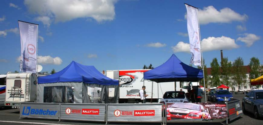
Naše servisní stany poskytují potřebné zázemí včetně internetu a obytného vozu

Pokud Vás tato nabídka osloví, může v tom případě sloužit jako základ k dalšímu jednání.