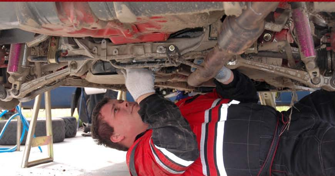
Pravidelná kontrola všech důležitých komponent vozu přímo při závodech