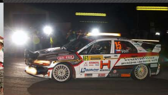
Jiří Volf při Rally Hustopeče 2008