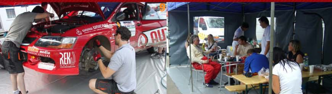
Mechanici APID racing service